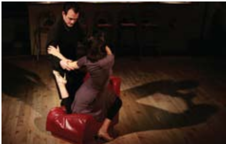
Cie. Union Tanguera