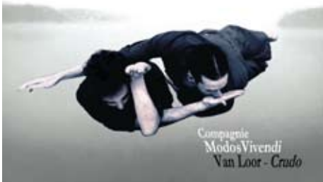
Cie. Modos Vivendi